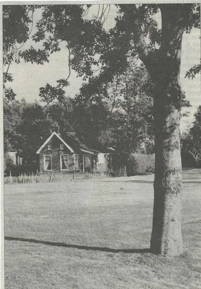
Eén van de nog weinig overgebleven woudhuisjes aan de Lutkepost.