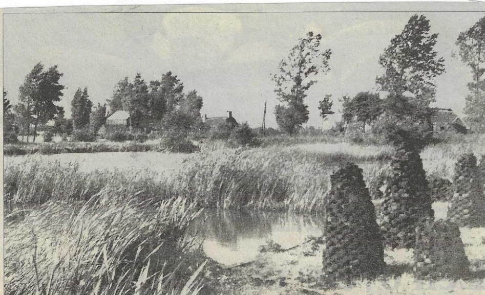
Tot 1948 werd er bij Lutkepost nog turf gegraven. Op de voorgrond de turfhopen, die stonden te drogen.

Volgens een persbericht d.d. 12 december 2006, zullen in deze nieuwe wijk - die ingeklemd ligt tussen de rondweg, de Buitenposter Vaart en de Kuipersweg/Lutkepost - maximaal 171 woningen komen. In meerdere fasen zal dit woongebied worden ontwikkeld.