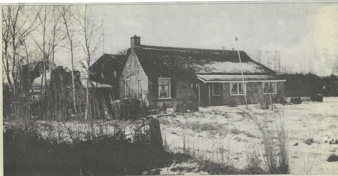
Woning, gebouwd in 1814, aan de Lutkepost, vanaf 1946 tot ongeveer 2000 bewoond door de heer Hendrik Henstra. Het is nog te zien dat het vroeger een kroegje is geweest.